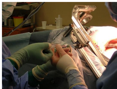
اقدامات بعد از عمل

✓ بیوپسی عمل باز: برای انجام بیوپسی باز، برشی از طریق پهلوی ایجاد می‌شود که امکان مشاهده مستقیم کلیه و بافت آن را به طور صد در صد فراهم کند. پزشک نمونه را تهیه کرده و پس از آن محل را با یک یا دو بخیه بسته و با پانسمان استریل می‌پوشاند.